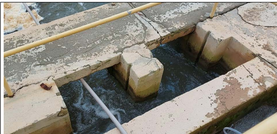
Fig. 05 - Entrada flocculador 01