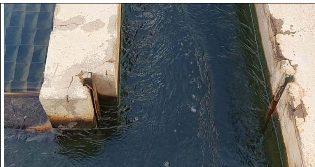
Fig. 02 - Saída do decantador 02 / calha de distribuição para os filtros