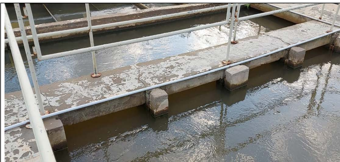
Fig. 06 - Saída do flocculador 01/entrada da calha de estabilização